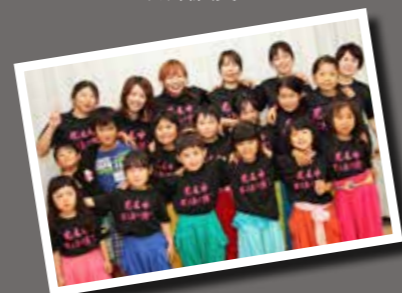
荒尾市盛り上げ隊 炭坑ガールズ