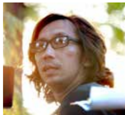
映画監督 行定 勲

●日時 6月12日(日) 開場: 午後 1 時 30 分 開演: 午後 2 時 ●場所 大ホール ●入場料 500 円 ※未就学児の入場はできません