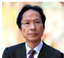
熊本県立劇場館長 姜 尚中