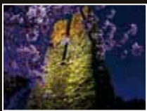
萩反射炉 [山口県・萩市]

全国11箇所の世界遺産をライトアップ! 明るい未来を願い聖なる夜だけの特別な灯 ※画像はイメージです。