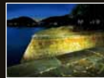
三角西港 [熊本県・宇城市]