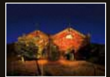
遠賀川水源地ポンプ室 [福岡県・中間市]