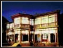
旧鹿児島紡績所 技師館(異人館) [鹿児島県・鹿児島市]