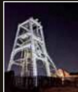
三池炭鉱 宮原坑 [福岡県・大牟田市]