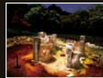
橋野鉄鉱山 [岩手県・釜石市]