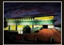
佐野常民と 三重津海軍所跡の歴史館 [佐賀県・佐賀市]