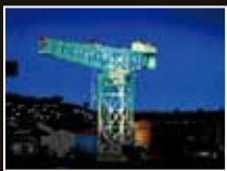
三菱長崎造船所 ジャイアント・カンテナパークレーン [長崎県・長崎市]