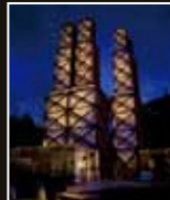
蕨山反射炉 [静岡県・伊豆の国市]