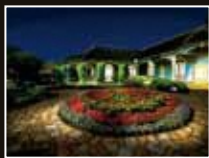
旧グラバー住宅 [長崎県・長崎市]