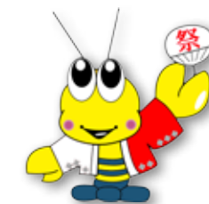
荒尾市マスコットキャラクター「マジャッキー」