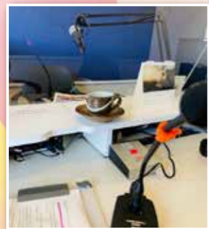
▲小代焼を取り上げた回の収録風景。焼き物のぬくもりが伝わるように、私物のカップを持ち込み、話をしました。