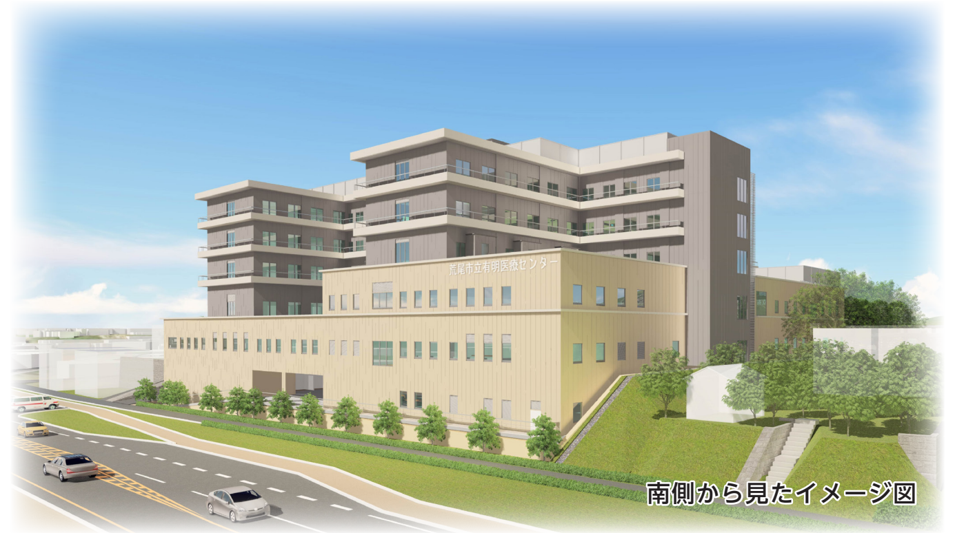
南側から見たイメージ図

令和5年10月の新病院開院へ向け、いよいよ4月から工事が始まります。新病院では、外来・病棟・救急などのさまざまな機能やサービスが更に充実します。