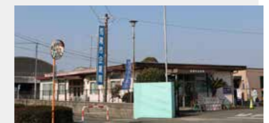
▲企業局は市民病院前から東へ500mほどです。

企業局は、土日祝日も開いています。 世帯での引越しや転出の際には、上下水道料金の変更・中止なども忘れないように手続きをお願いします。 ※井戸水で下水道を利用している世帯は、世帯員数で下水道使用料を算定していますので、世帯員の増・減があるときは、企業局お客様センターで手続きをお願いします。