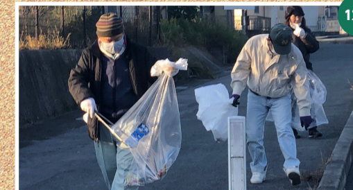
緑ヶ丘地区協議会