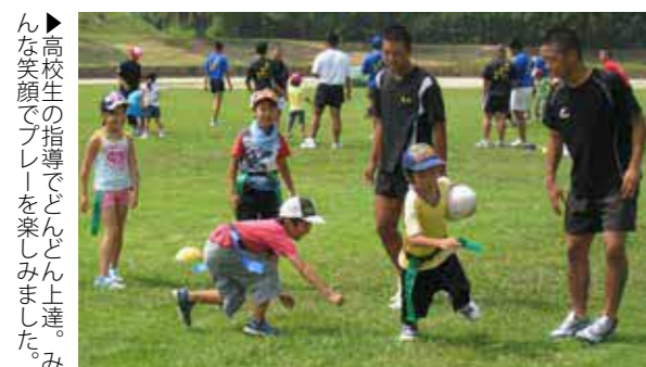
▶高校生の指導でどんどん上達。みんな笑顔でプレーを楽しみました。

7月4日～21日の毎週土曜日、計3回にわたって第12回タグラグビー教室を開催しました。この教室は、荒尾高校ラグビー部の部員と顧問が中心となって市内の小学生にタグラグビーを指導し、子どもたちの健全育成を図るとともにラグビーの知名度を上げる取り組みです。