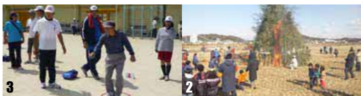
1 音と光の祭典。昼と夜のバラエティに富んだステージ発表を前に、地域外からファンが集います。今年は9月29日(土)開催。(詳しくは29ページ) 2 1月に行うどんごやは、元気づくり委員会主催。大人も子どもも楽しく参加する交流の場です。 3 ベタンク大会。地区協議会主催で、スポーツを通して地域の絆をはぐくんではいます。

第2回から、一小校区元気づくり委員会交流部会として「音と光の祭典」を運営しています。交流部会には音楽好きの人が多くいるので、今の自分たちができる最大のことをやろうと、みんなが楽しみながらやっています。僕が音楽をやっているのでも、知り合いを通じて出演者を出演したり、地域の子どもたちに出演してもらったりして、地域の人も地域外の人も観に来なくなるように意識して企画しています。また、満月に近い土曜を開催日に選んだり、小行灯を灯したりして会場の宮崎兄弟の生家を演出。出演者にも演奏しやすいと評判がいいんですよ。年々来場者も増え、イベントとしてレベルが上がっていると思います。これからも楽しみながらイベントに携わっていききたいです。