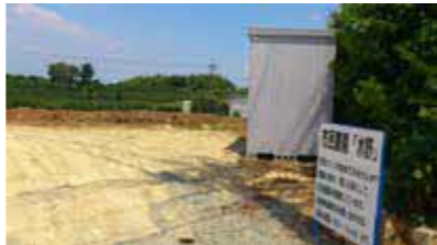
③市民農園「菰屋」(菰屋10-3)