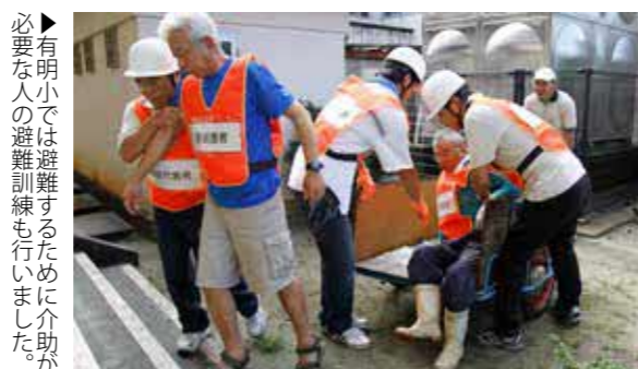
▶有明小では避難するために介助が必要な人の避難訓練も行いました。

東日本大震災に学んで、「熊本県津波避難訓練実施支援モデル事業」として津波避難訓練を行い、沿岸部の住民と関係者合わせておよそ千人が参加しました。地域公民館の放送や防災サイレンで津波発生を知った参加者は、避難経路や危険箇所を確認しながら小学校などに開設した地区避難所に避難しました。