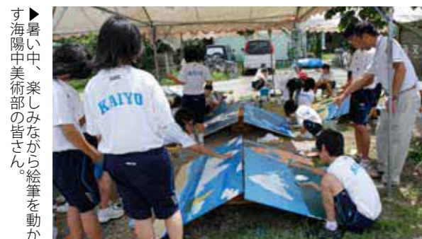
▶暑い中、楽しみながら絵筆を動かす海陽中美術部の皆さん。

増永海岸で、海の美術館の壁画制作は行われました。「海の美術館」は、地区の人たちにもっと海を身近に感じてもらおうと、海岸の堤防に壁画を設置しています。この取り組みは7回目を迎え、現在増永海岸と蔵満海岸に設置されている壁画は約140枚あります。今回は荒尾高校と荒尾海陽中学校の美術部も制作に携わりました。壁画を設置してから、不法投棄が減少したり、散歩をする人が増えてきました。海の美術館は、海岸の環境美化にも役立っています。