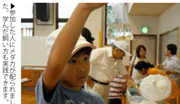
▶参加した人にメダカが配られました。学んだ飼育方も実践できます。

めだかの学校は二小元気会の主催で、メディア交流館で行われました。自然環境を考える取り組みとして毎年行われていて、地域の小学生などに参加を呼び掛けています。身近な生き物であるメダカの生態を学び、自然環境を大切にすることを目的としています。