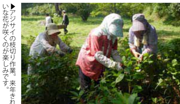
▶アジサイの枝切り作業。来年きれいな花が咲くのが楽しみです。

荒尾市花いっぱい推進協議会、荒尾ライオンズクラブ、小岱作業所、地域の皆さんなどおよそ30人が参加して、荒尾市野球場東側の空き地1,800㎡の除草作業と、アジサイの挿し芽勉強会、アジサイの枝切りを行いました。この事業は暮らしのまちプロジェクトの一つで、定住しやすい環境づくりを目指し、自然と共生した美しい街並みづくりを協働で行うものです。