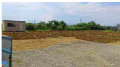
②市民農園「水野」(水野909番地)