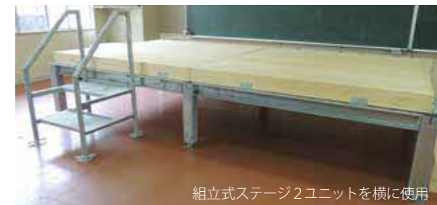
組立式ステージ2ユニットを横に使用