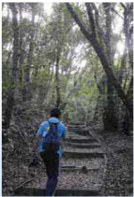
▶中央コースの登山道。やさしい木漏れ陽と澄んだ空気が心と体を癒してくれます。

8月6日午前7時30分、小岱山駐車場を出発。ここから登山口まで坂道が1キロほど続きます。到着する頃にはすでに足が疲れてしまい、運動不足を実感しました。