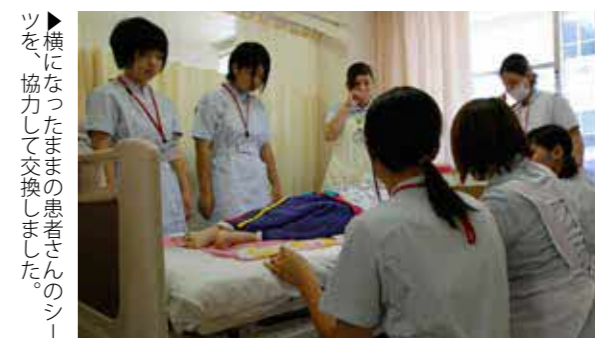
▶横になったままの患者さんのシーツを協力して交換しました。

市民病院で、高校生の一日看護体験が行われました。近隣の高等学校から男性7人女性8人が参加し、看護を体験しました。