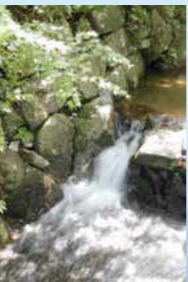
▶ビクターセンター前。源流があつまり、菜切川として荒尾に流れていきます。