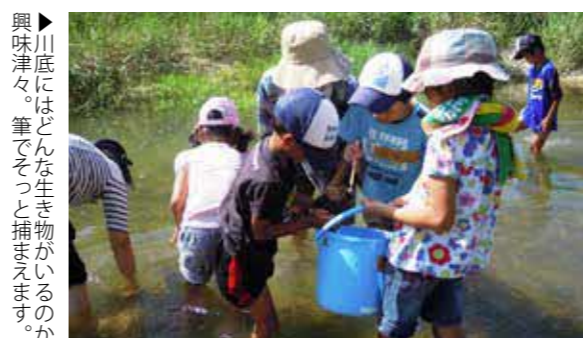
▶川底にはどんな生き物がいるのか興味津々。筆ですくとつまめます。

岩本橋付近の関川で開催している生物教室は、今年16回目を迎えました。荒尾市、南関町、大牟田市の児童27人が参加し、川に入って川底にすむトビケラなどの水生生物を捕まえました。その後、試薬や道具を使って水質を調べ、捕まえた水生生物を分類して川の汚れ具合を判定しました。今年は5段階中2番目の「親しめる水環境」で、昨年より良い結果になりました。参加者は「自由研究に役立ちます」「川をきれいにしようと思った」と感想を寄せました。