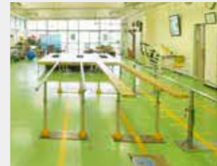
◀リハビリテーション室

現在当院のリハビリテーション技術科には、理学療法士13人、作業療法士5人、言語聴覚士2人がいます。この中から2人の理学療法士が、専門の医師と看護師とともにがんリハビリテーションの合同研修を修了しました。このことで、多職種のスタッフが連携する総合的ながんのリハビリテーションができるようになりました。 現在は一部の入院患者さんに実施していますが、少しずつ対象を広げていく予定です。