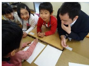
放課後子ども教室(有明小) 有明高校職場体験で高校生も参加