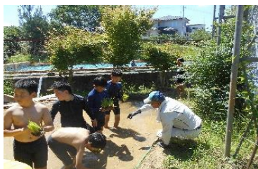
③ 地域学校協働活動(桜山小)