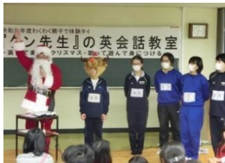
① 中央公民館「子ども英語教室」 (中学生ボランティアスタッフも参加)