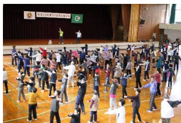
ラジオ体操講習会