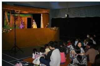
図書館まつり (人形劇、クイズラリー)