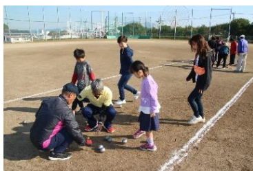
② ムツゴロウペタンク大会