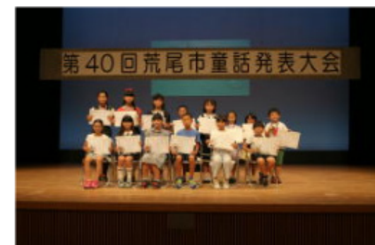
◀以前の童話発表会の授賞式の様子

※中央公民館ロビー「マナビの間」で行います。 ※参加する皆さんにはマスクの着用や咳エチケットなどの感染症予防をお願いします。 ※参加者が多い場合は人数制限を行います。