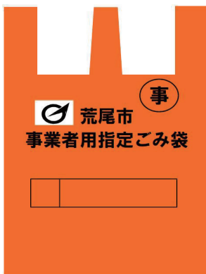
大 (45 l)