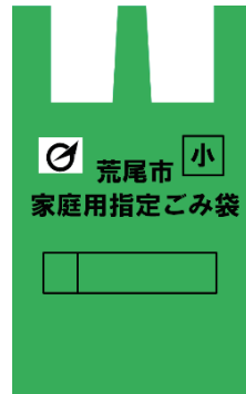
小 (15 l)