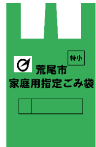
特小 (8 l)