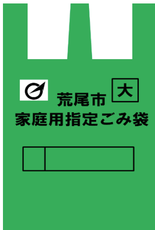
大 (45 l)