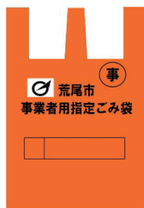
小 (15 l)