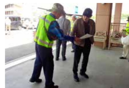
▲昨年はあらかわシティモールでPRのためのティッシュ配りを行いました