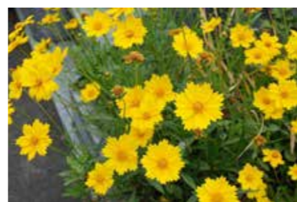
▲オオキンケイギク