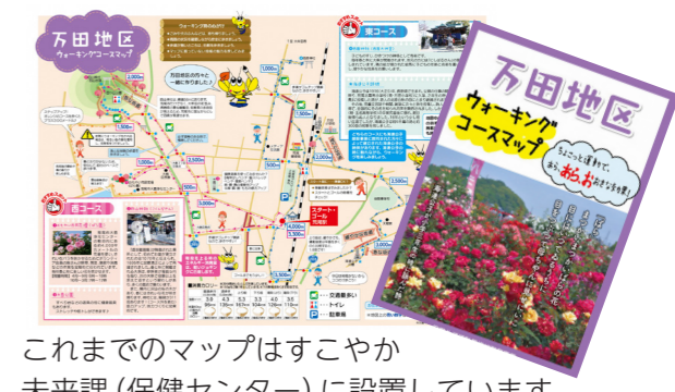
これまでのマップはすこやか未来課 (保健センター) に設置しています。

地 区の皆さんと作成した万田地区のマップを、広報と併せて万田地区全世帯に配布しています。これまでに 7 地区 (有明、平井、井手川、荒尾、緑ヶ丘、万田中央、八幡) で作成しました。 いつでも、どこでも、誰でも手軽にできるウォーキングは、血の巡りをよくする、脂肪の燃焼を促す、骨を強くするなどの効果がある有酸素運動です。 マップ裏面には、ウォーキングのポイントや、室内でできる運動なども掲載。マップを片手に、自然や歴史を感じながら荒尾のまちを歩いてみませんか。