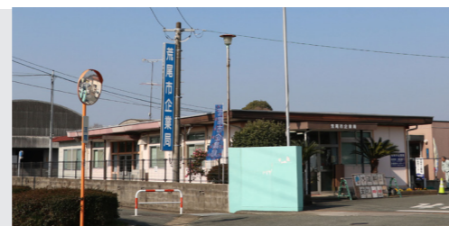
▲企業局は市民病院前から東へ500mほどです。

企業局は、土日祝日も開いています。世帯での引越しや転出の際には、上下水道の変更・中止なども忘れないように手続きをお願いします。※井戸水で下水道を利用している世帯は、世帯員数で下水道使用料を算定していますので、世帯員の増・減があるときは、荒尾市企業局お客様センターで手続きをお願いします。