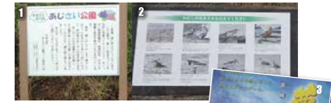
1 あじさい公園に設置した案内板 2 荒尾干潟でのバードウォッチングを楽しむ人への渡り鳥説明看板 3 郷土の偉人宮崎兄弟の活躍を分かりやすく漫画にし、次代を担う子どもたちに知ってもらったためのリーフレットを作成 ◆1～3のような事業に寄附金を活用しています