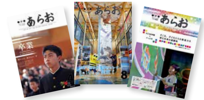
▲毎年力作ぞろいの「あらの」が届きます。