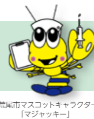
荒尾市マスコットキャラクター「マジックキー」