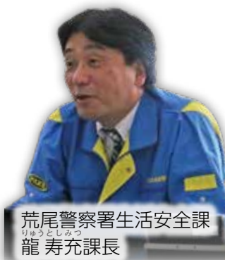
荒尾警察署生活安全課 龍 寿充課長

10月は特に詐欺の相談や被害が多く、1日に50件の相談がある日もありました。荒尾署管内では2人の逮捕者が出ており、皆さんもいつ被害にあってもおかしくありません。特に、電話でお金の話をされたときは要注意です。すぐに警察に相談してください。