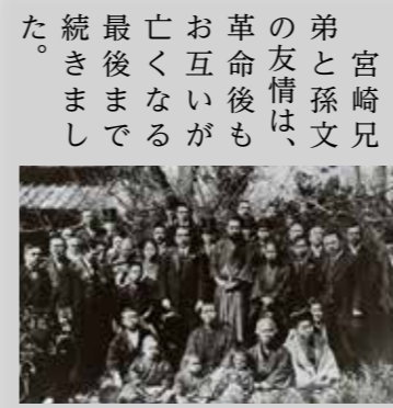
▲大正2年、孫文が宮崎家を訪れた時の写真。

全国農業新聞が発行する農業総合専門誌です。最新の農政情報を分かりやすく解説し、農業経営にも役立つ情報や農業関連イベントなど話題が盛りだくさん。購読を希望する人は農業委員会事務局にお問い合わせください。購読料は月額700円です。