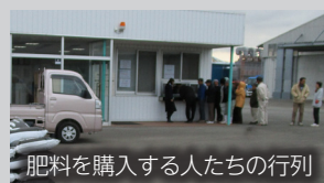
本社以外の販売所 荒尾市孤屋、玉名市滑石 ※無償サンプルあり

当社の有機肥料は土壌を柔らかくし、肥効を下げない豊かな土壌へと改良。汚泥中のウイルスなども完璧に死滅しているため安全です。野菜でも水田の米でも、作物が本来の栄養と旨味を発揮していきいき育ち、大変好評をいただいています。農地への肥料散布事業も行っています。