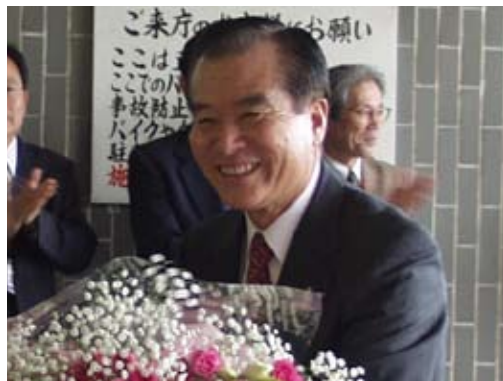
一再選後初の登庁の様子

住 所 ：荒尾市蔵満 239 番地1 生年月日 ：昭和 20 年8月 16 日 略 歴 ：有明小、一中、済々黌高校、日本大学理工学部卒。 会社員を経て昭和 58 年より熊本県県議会議員。（平成 14 年 12 月まで、5期）平成 15 年1月 18 日から第 19 代荒尾市長就任。 趣 味 ：読書、ジョギング（毎朝 30 分ほど、海岸を走っています）