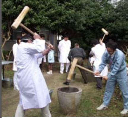
ぺったん、ぺったん 市民病院恒例の餅つき つきあがったお餅は患者さんに配られました。