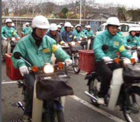
荒尾郵便局 今年は年賀状が何枚届くかな～