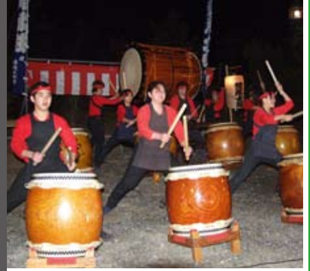
四ツ山神社で荒尾太鼓による年越しの演奏 力強い太鼓の音でカウントダウン!