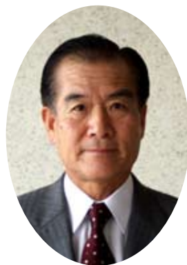
市長 尾市 淳浩 前 荒尾 前 畑