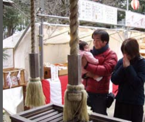
野原八幡宮 初詣の様子 今年もみんなが元気で過ごせますように…

「もう若くないんだしね!」 「史」 本年も『広報あらお』をよろしくお願いいたします。