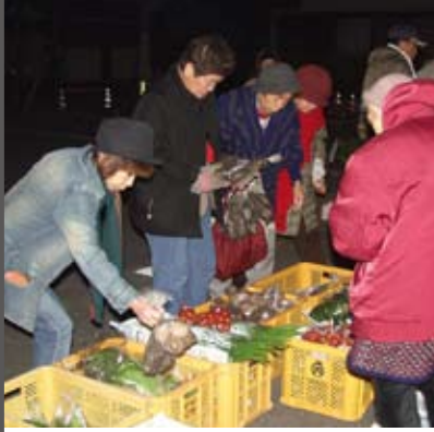
メディア交流館 朝市 お正月の準備に大忙しです!!