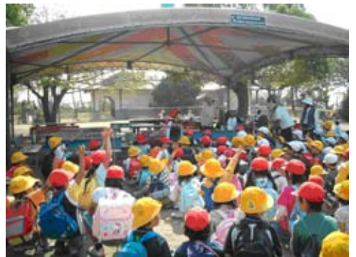
1・2年生による合同遠足風景

⑤事務部会 9月13日（水）、11月8日（水）開催 四小から緑ヶ丘小へ運ぶものの整理は、一般備品、教材備品、図書についてはすべて整理がついています。