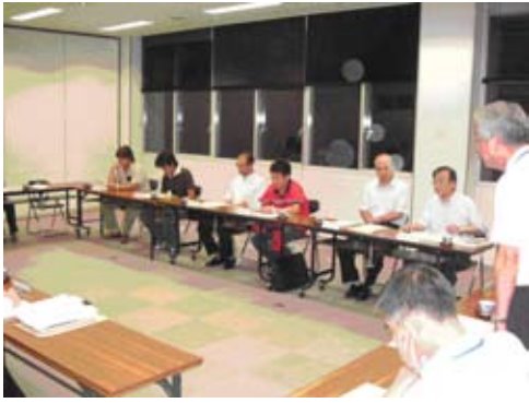
第1回統合準備委員会

※今後も各部会で引き続き協議がなされます。この「広報あらか」紙面と併せて、市ホームページでもお知らせしますので、ご覧ください。