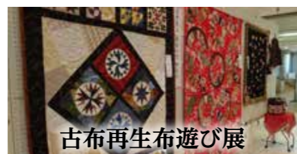
古布再生布遊び展

●日時 10月30日(水)～11月3日(日) 午前10時～午後6時 ※3日は午後3時30分まで ●場所 ギャラリー