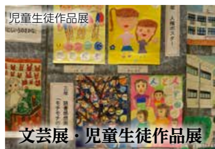
文芸展・児童生徒作品展

●日時 11月23日(土)、24日(日) 午前10時～午後7時 ※24日は午後4時まで ●場所 ギャラリー