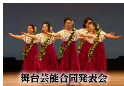
舞台芸能合同発表会

●日時 11月23日(土)、24日(日) 午前9時～午後6時 ※24日は午後4時まで ●場所 アートフォーラム ※来場者には、松の苗を配布します。(数に限り有り)