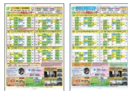
▲ごみ・リサイクルカレンダー (2019年度版)