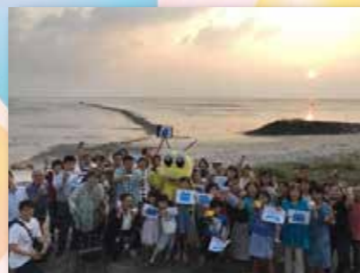
▲干潟をバックに記念写真。屋の部では 卒業後について発表しました!

体験住宅利用者の感想や、先輩移住者のインタビュー内容、転 出アンケートの「荒尾市の良かった点、悪かった点」など、さま ざまな視点から見た荒尾市について、ホームページ掲載に向け作 業を進めています。また、次の協力隊へのバトンタッチに向け、 各地域の特色を生かした個別の体験や案内を増やしていけたらと 思い、地区協議会の皆さんなどにご協力いただき、地域の人との 交流を増やしています。プライベートで参加した「荒尾干潟で乾杯」 では、被災者支援や環境保全活動をする人、岱志高校理科部員さ んの素敵な講演を聞き、地域の人との楽しい時間を過ごしました。