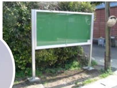
↑まちの情報を伝える掲示板 ←防犯灯が夜道を照らします

コミュニティの健全な発展を図ることを目的としたコミュニティ助成事業により、有明校区内にコミュニティ掲示板及び防犯灯が整備されました。このコミュニティ助成事業は、宝くじ普及広報事業費を財源として財団法人自治総合センターが助成決定を行うもので、今後の有明校区社会教育連絡協議会のますますの活性化が期待されます。