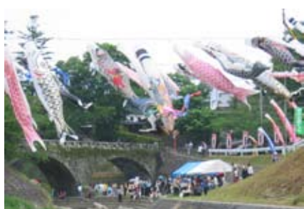
岩本橋周辺を泳ぐ鯉のぼり

平井校区の「地域元気づくり事業」の一環として、「第3回鯉のぼりとレンゲまつり」が開催されます。県指定重要文化財である岩本橋を流れる関川の上にワイヤーを張り渡し、呼び掛けて集めた鯉のぼりや矢旗を飾り付けることで、岩本橋の存在を多くの方に知ってもらい、憩いとふれあいの場所となるように実施します。