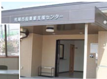
快適なオフィス環境を整備しています！

「チャレンジプラザあらお」落成式が、3月30日（木）に行われました。当施設は、本市で創業を予定している方や、創業間もない企業に事業スペースの提供をはかり、また入居者の経営相談や技術相談支援など起業化の促進を図るためのものです。オフィス3室のほか、会議室、相談室等を備えています。