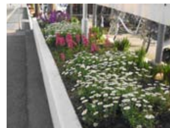
↑ボランティア団体により維持管理されている市民病院の花壇

5人以上の団体が自主的に公園や街路等の公共的な場所へ花壇等を設置、花の育成、管理まで行う活動で、且つ、不特定多数の市民が観賞できる場所への花植え活動に対して、必要な花苗の一部を配布します。