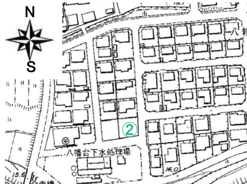
八幡台団地宅地分譲位置図