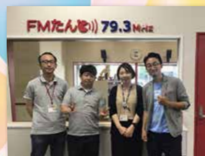
▲あらたま地域おこし協力隊ネットワークは、通称「TAN(タン)」になりました！