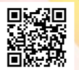
荒尾市地域おこし協力隊 Instagram