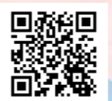
荒尾市地域おこし協力隊 Facebook