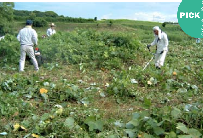
▲ 葛やセイタカアワダチソウなどが、大人の身長くらい茂っていた耕作放棄地を、少しずつ刈っていく作業は一仕事。職員が耕作放棄地対策に乗り出す取り組みは、県内でも初めてだそうだ。