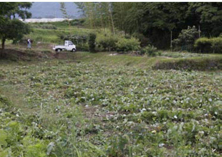
▲ 作業の終わった畑。土手の草もきれいに刈り取られた。場所柄、車などが入りにくいところにあるため、秋にまずは手間のかかりにくいジャガイモを植えようか、と作業をした職員の声も弾んだ。

7月18日(日)、金山地区で市農林水産課職員が、耕作放棄地の解消作業を行いました。