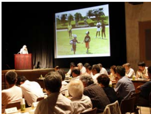
▲ 上下とも、会議の様子。下の写真のように、実際の事業について写真などを多く使って現在の進み具合が発表された