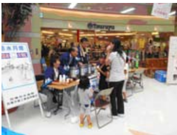
昨年の様子 ◀ 試飲コーナー