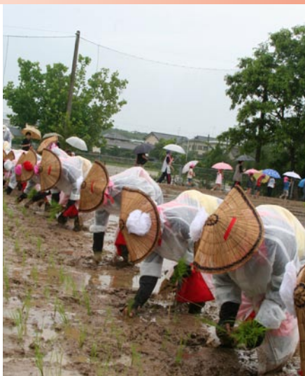
▲左…八幡小学校5年生の皆さんの御田植体験。慣れない田のぬかるみを楽しみながら、苗をやさしい手つきで植えていった。右…早乙女の皆さんの田植えの様子。今年は雨の中、レインコートを着用しての御田植祭となり、鮮やかで風情のある衣装が隠れていたのが残念。