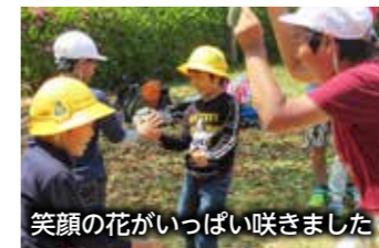
笑顔の花がいっぱい咲きました

12人の1年生が元気に入学しました。歓迎遠足では1年生と早く仲良くなれるように、全校児童で交流遊びを楽しみました。ちょっと緊張ぎみの1年生を笑顔いっぱいにしようと、上級生が積極的に声をかけました。