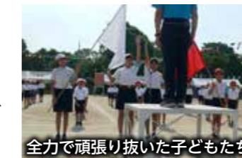
全力で頑張り抜いた子どもたち

「全力笑顔 全力本気顔 全力勝負でつかめ優勝!」のスローガンのもと、6年生がリーダーとなって、練習から本番まで一生懸命がんばりました。勝ち負けに関係なく、全力を尽くした子どもたちの顔は、笑顔でいっぱいでした。