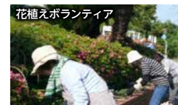
花植えボランティア

子どもたちの笑顔のため、保護者や地域の皆さんからたくさんのお力をいただいています。「花植えボランティア」、「読み聞かせ」、「いも植え・いも掘り」や「潮干狩り」など、温かい地域に支えられ、さまざまな体験を通して笑顔いっぱいに成長している清里っ子です。