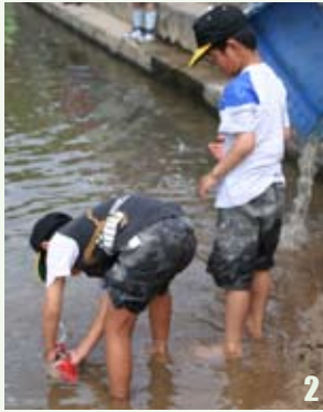
1 フリーマーケットも賑わいました 2 鯉の放流は飛び入りでのイベント。子どもたちも興味津々 3 鯉のぼりが泳ぐ下で川遊び