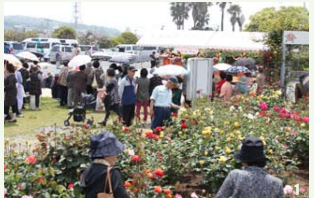
1 咲き乱れるばらとステージ。どちらも盛況 2 真紅のばらを前に、絵筆をとる手も滑らかに

「おもやい市民花壇の会」の皆さんが丹精込めて育てたおよそ千900株のばらが咲き競うなか、地域住民によるステージイベントやフリーマーケット、金魚すくいやばら苗の販売が行われました。 今年は4月に気温が上がりやすい天候が続いたため、ばらの開花が遅れていましたが、連休中に温かい陽気に恵まれたことで、祭り当日は見事に咲きそろったということです。 この日はおよそ千人が訪れ、大切に育てられた鮮やかなばらの花を愛で、フラダンスや日本舞踊、大正琴の演奏など、バラエティに富んだ舞台を楽しんでいました。