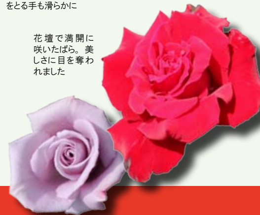
花壇で満開に咲いたばら。美しさに目を奪われました

「おもやい市民花壇の会」の皆さんが丹精込めて育てたおよそ千900株のばらが咲き競うなか、地域住民によるステージイベントやフリーマーケット、金魚すくいやばら苗の販売が行われました。 今年は4月に気温が上がりやすい天候が続いたため、ばらの開花が遅れていましたが、連休中に温かい陽気に恵まれたことで、祭り当日は見事に咲きそろったということです。 この日はおよそ千人が訪れ、大切に育てられた鮮やかなばらの花を愛で、フラダンスや日本舞踊、大正琴の演奏など、バラエティに富んだ舞台を楽しんでいました。