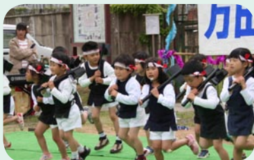
万田保育園の園児による踊りの様子。 元気いっぱい踊りました。

およそ400人が訪れ、敷地外からの史跡ガイド、地域の人たちによる演芸発表を楽しみました。その後、炭坑節の総踊りとビンゴゲームが行われ、参加者は大いに沸いていました。