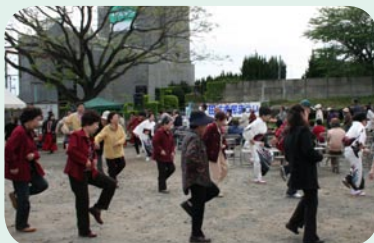
←観て楽しんだあとは踊って楽しみました。 演目はもちろん炭坑節です。