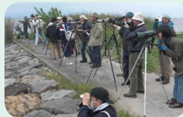
←寒さにも負けず、夢中で観察。

荒尾海岸は年々、シギ・チドリ類の飛来数が増える傾向にあり、日本でも有数の飛来地となっています。