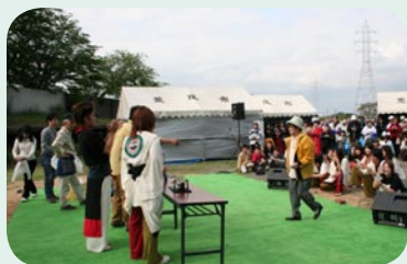
ビンゴゲームの様子→ 石炭の色から連想する「黒」にこだわった品と、地元産の野菜や果物などが賞品でした。