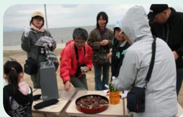
←有明元気づくりのみみなさんからこの差し入れ。観察前に舌つづみを打ちました。