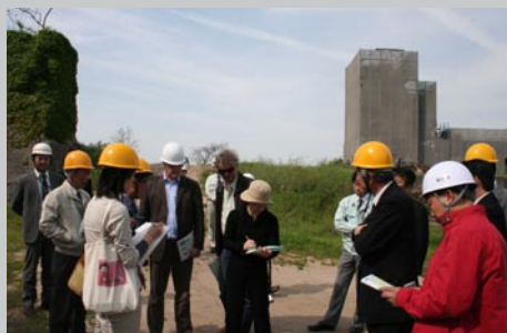
↑ 海外専門家委員の視察も3度目を数えます。

万田坑について、櫓と巻揚機などが当時のままの状態が残っていることと周辺施設を含め採炭の様子が分かる状態で残っていることで、高い評価をいただきました。また、現在行っている保存修理工事についても、世界遺産登録の条件の一つである「人類の歴史の重要な段階を物語る建築様式を後世に残している」という観点から好評価を得ました。