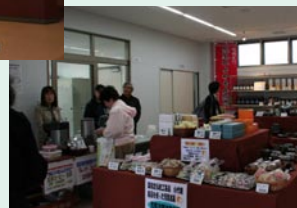
物産販売コーナー。→ 梨ドレッシングや小代焼などの特産品を通じて荒尾市をPRします。