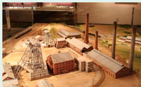
↑ 模型の様子。パネル操作で主要施設の場所が示されます。