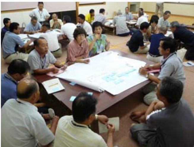
清里元気づくり会ワークショップ風景

「環境美化」や「住民の“ふれあい”」、「健康」、「地域の“安心安全”」に関する部会が設けられ、ワークショップ形式でそれぞれのテーマに沿った取り組みが検討されています。