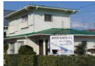
▲①おれんちのカフェ