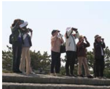
↑ どんな鳥がいるのかな～