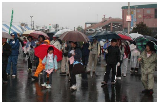
↑ウォーキング前の準備体操