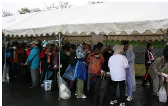
↑だご汁で冷えた体が温まりました