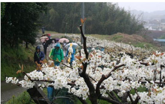
↑梨の花を見ながら歩きました

4月4日（土）、市内外から約250人が参加し、約10kmの行程を歩きました。当日は、雨にもかかわらず、参加者たちは梨の花と桜を楽しみました。