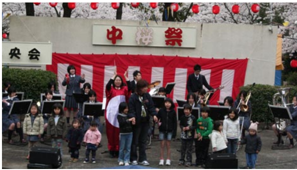
↑有明高校吹奏楽部と子どもたちの競演の様子

野外音楽堂は長年利用されておらず荒れた状態でしたが、この日のためにボランティアの皆さんが清掃をされました。当日は満開の桜の下、食品バザーやステージイベント、フリーマーケットなどが行われ多くの人で賑わいました。