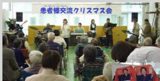
12月20日(土)、患者様交流クリスマス会が開催されました。ボランティアのバンドメンバー「パシオーネ」さん、菊踊会の方々にご協力をいただき、患者さんをはじめ、ご家族の参加で、楽しい時間を過ごすことができました。