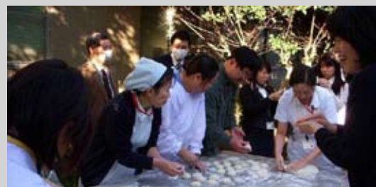
12月26日(金)、職員でもちつきをしました。できあがった鏡餅は各病棟に飾られました。