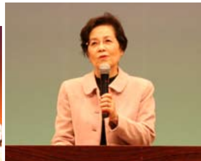
↑潮谷義子前熊本県知事による人権講演会