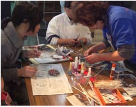
→新聞紙コサージュ作りの様子

昼の部では廃油から生まれた燃料の実演やダンボールコンポスト(ダンボール箱と生ごみを利用した堆肥作り)の展示、新聞紙を利用したコサージュ作りなど、楽しみながら環境問題について考えることができました。夜の部では廃油で作ったキャンドルに灯りをともし、コーラスやハンドベルなどの演奏がありました。