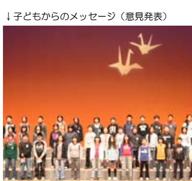
↓子どもからのメッセージ(意見発表)