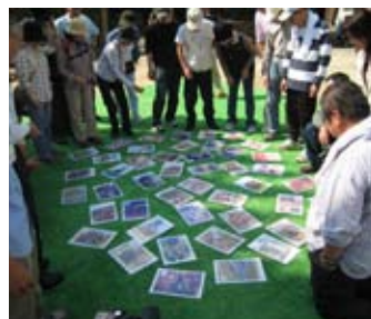
↑世界遺産サミットイン万田坑