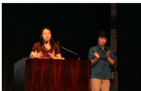
↑都市経済評論家 加藤康子氏による基調講演(テーマ:産業遺産と世界の街の取り組み)