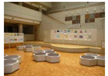
平成19年度から占用可能となった「アートフォーラム」(料金：午前の区分200円、午後の区分300円、夜の区分500円、一日利用1,000円)