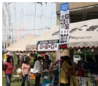
↑秋の収穫祭と窯元の新作業出し