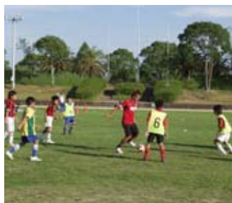
↑9月27日(土)に行われたロシア熊本コーチによるサッカー教室