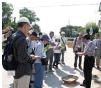
↑J-R九州ウオーク(荒尾競馬場で説明を受ける参加者たち)