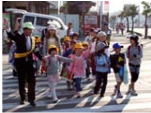
▲昨年4月に行われたタッチ運動のようす

期間中、市・荒尾警察署では、関係機関団体のご協力を得て、各種の交通安全行事を行います。ご協力をお願いします。