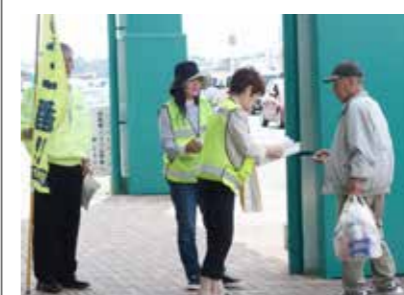
▲昨年のPR活動。皆さんのお越しをお待ちしています

の悩み、妊娠や子育ての不安、失業や経済的困窮による生活上での心配事など、さまざまな相談に応じます。相談内容に応じて、必要な支援が受けられるよう、「住民と専門機関とのつなぎ役」となります。 園福祉課総務係 ☎63・1406