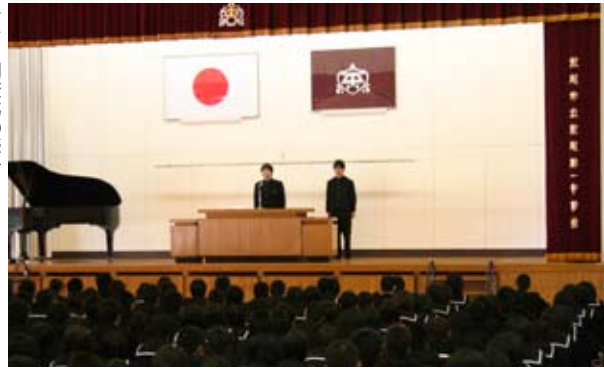
→一中開校式の様子