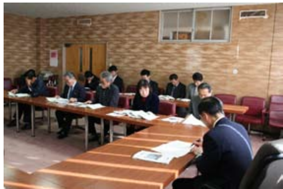
プランの説明をされる清里元気づくり会の皆さん