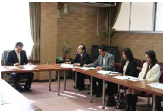
プランの説明をされるよかまち中央会の皆さん