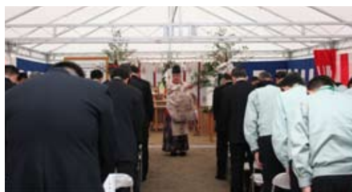
▲安全祈願祭は施工業者であるメタウオーター・大日本土木特定建設工事共同企業体と、荒尾・大牟田両市関係者が出席して行われました。

2月9日(火)、大牟田市と荒尾市が建設する共同浄水場施設の安全祈願祭が行われました。