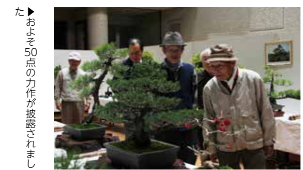
た▶おおよそ 50 点の力作が披露されました

小岱松保存会は文化センターで盆栽展を開催しました。荒尾市の市木・小岱松は、いくつも樹皮が重なり、幹の表面に亀の甲羅のように割れた模様があるのが特徴です。以前は多くの小岱松が自生していましたが、松くい虫などが原因で自然木はあまり見られなくなりました。小岱松を出品した人は「先祖から受け継いだものなので、大切にしたいです。育てるのは難しいですが、自分が育てた松を多くの人に見てもらえてうれしい」と話していました。