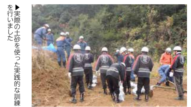
▶実際の土砂を使った実践的な訓練を行いました

総合防災訓練を市内各所で開催しました。災害を想定して、市役所・警察署・消防署などで情報伝達訓練を行ったり、土砂災害発生を想定した行方不明者捜索訓練や救護訓練などを行いました。多くの防災関係機関が参加し、災害時にそれぞれの機関で担う役割について、関係機関と連携した訓練を実施。同日、自主防災組織リーダー研修会も開催しました。訓練に参加した人は「災害について勉強になりました。地域防災に生かしたい」と話していました。