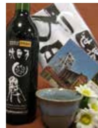
世界遺産登録セット (3千円)