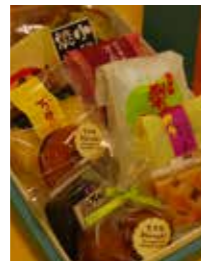
荒尾かぶれの詰め合わせ (写真のセットで2千円)

万 田坑、梨や干潟など荒尾らしい品をそろえてお待ちしています。商品によって数に限りがありますので、予約をお勧めします。希望と予算に合わせて詰め合わせますので、気軽にご相談ください。