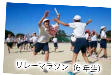
リレーマラソン(6年生)

昨年度は、「温かい学級集団づくり」に力を入れ、学習者主体の学習が成り立つための基本を学びました。関連した取り組みの一つとして、「リレーマラソン」を実施しました。子どもたちは自ら設定した目標を達成しようと、全員で力を合わせて突き進みました。PTAとおやじの会の共同で「42.195km強歩会」も実施され、集団づくりに一役買いました。