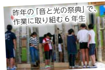
▶昨年「音と光の祭典」で、作業に取り組む6年生