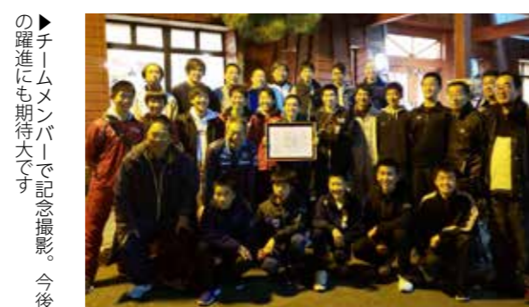
▶チームメンバーで記念撮影。今後の躍進にも期待大です