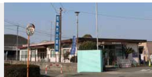
▲企業局は市民病院前から東へ500mほどです。

企業局は、土日祝日も開いています。世帯での引っ越しや転出の際には、上下水道の変更・中止なども忘れないように手続きをお願いします。※井戸水で下水道を利用している世帯は、世帯員数で下水道使用料を算定していますので、世帯員の増・減があるときは、荒尾市企業局お客様センターで手続きをお願いします。