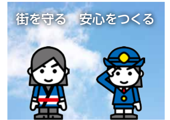
▲全国消防イメージキャラクター 消太